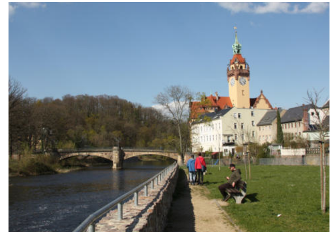
Oberwerder mit Rathaus