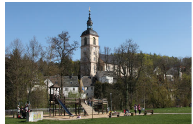
Oberwerder mit Kirche und Spielplatz