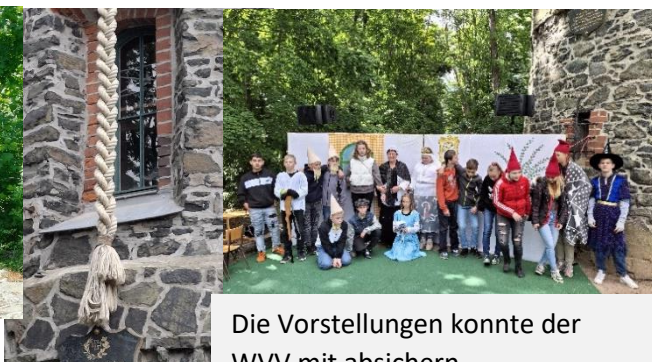
Die Vorstellungen konnte der WVV mit absichern