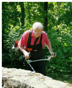
Vorbereitung des Geländes