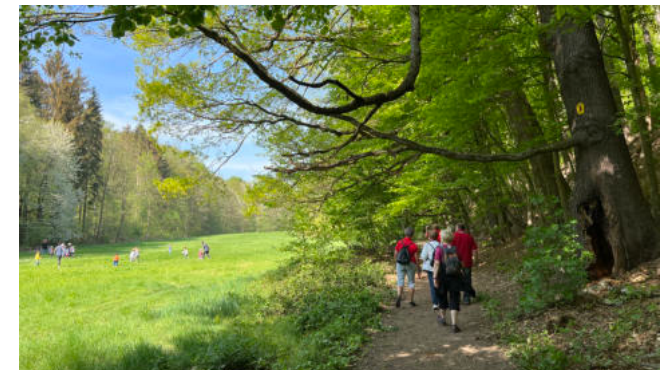
Wanderweg im Sauergras