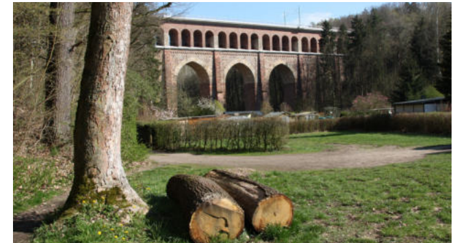
Gartengruppe mit Heiligenborner Viadukt