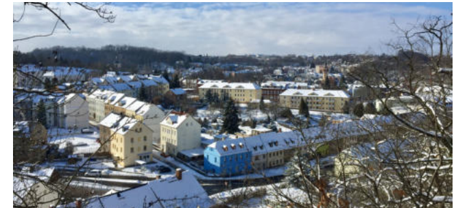
Blick auf die Oststadt vom Majoranberg