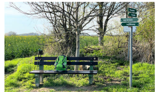
Wanderweg-Kreuzung oberhalb Kriebethal